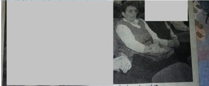
A meghívottak több mint harmincszor adtak már vért 1999. nov. 23.