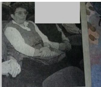
A meghívottak több mint harmincszor adtak már vért 1999. nov. 23.